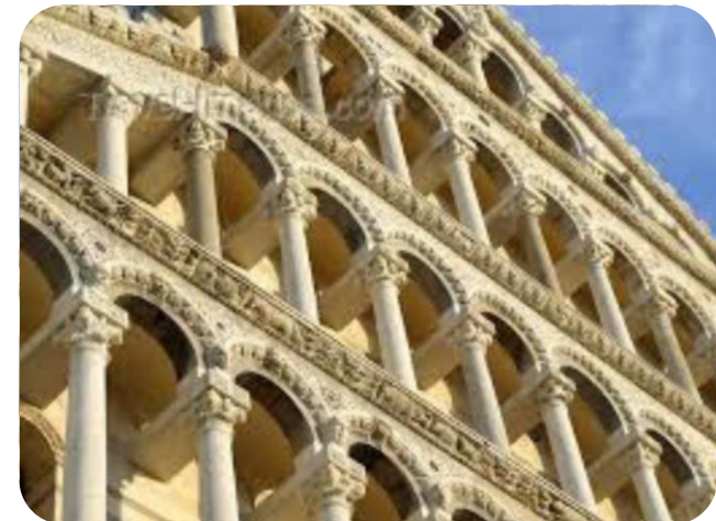
Pisa, particolare della Torre