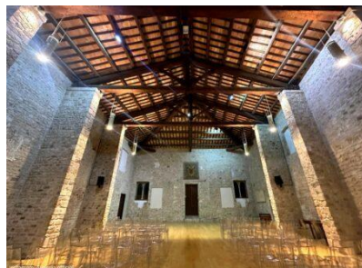
Sala della Ragione Civico Palazzo Jacopo da Iseo (1159-1163) 12/Giugno/26