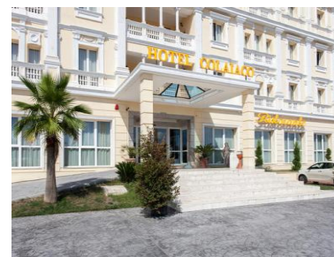
Sala Congressi Hotel Colaiaco Via Anticolana, 45 12-13/Giugno/26